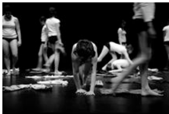
MOEBIUS KIDS